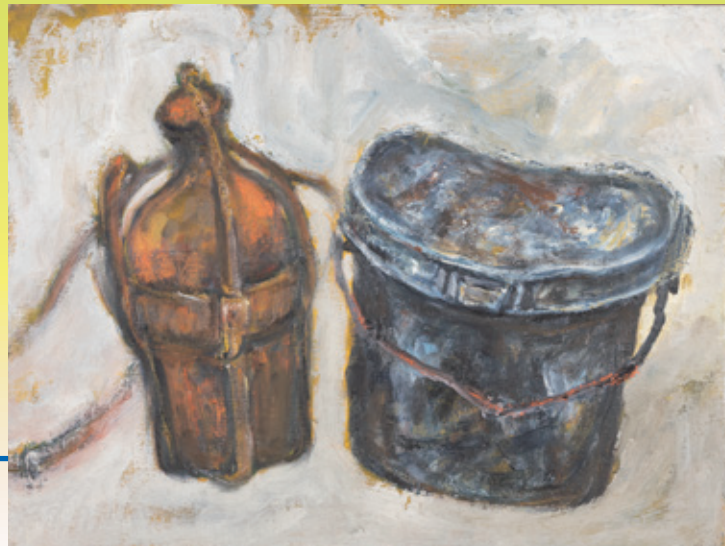
川上貞一「飯盒と水筒」