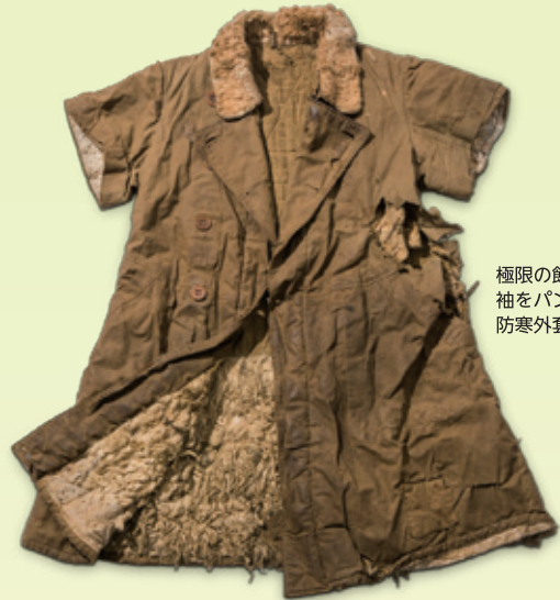
極限の飢えの中、 袖をパンと交換した 防寒外套

本展では、戦争がもたらした苦難や昭和の人々のくらしを、当時の富山県の写真や実物資料を交えて紹介します。