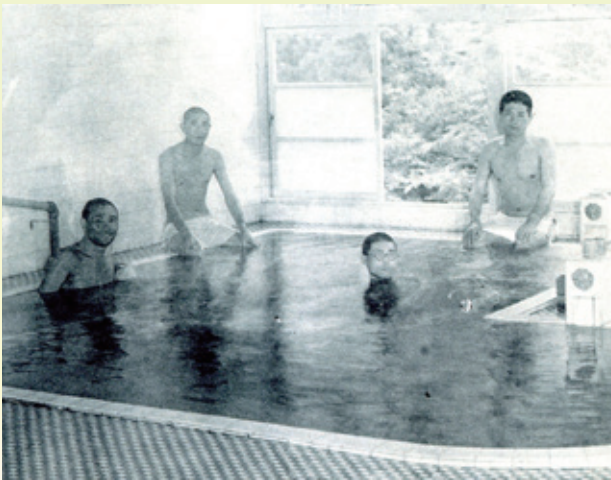
傷痍軍人宇奈月温泉療養所

しょうけい館(戦傷病者史料館)は、戦傷病者とそのご家族が、戦中・戦後に体験した労苦を後世に伝えるための施設です。本展では、富山県の戦傷病者の体験や、戦時中県内にあった医療施設について紹介し、義足などの実物資料を展示します。また、富山県出身の戦傷病者の証言映像も上映します。