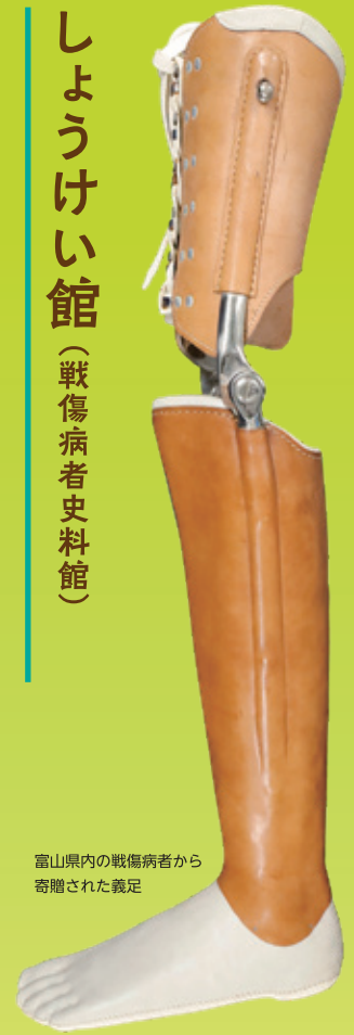
富山県内の戦傷病者から 寄贈された義足