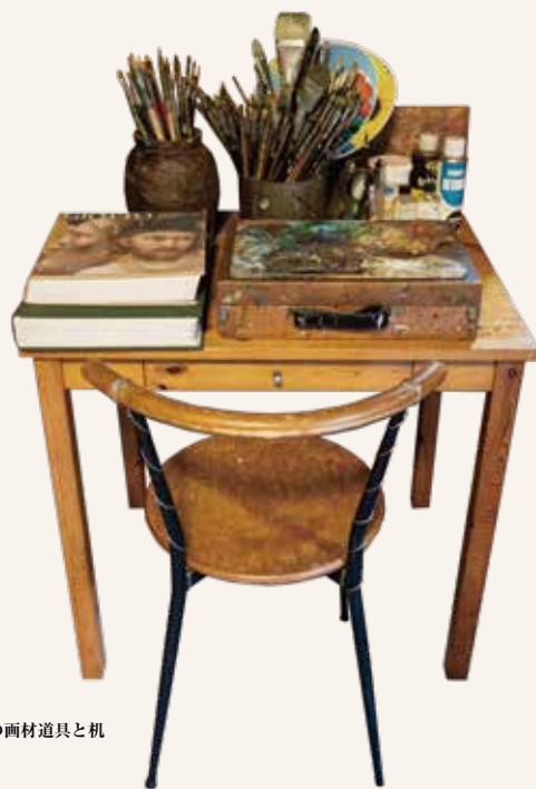
愛用の画材道具と机