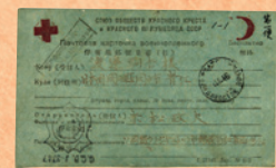
シベリアに抑留された俘虜が岡山の親族にあてた葉書