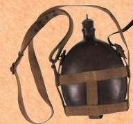
陸軍の軍曹が使っていた水筒 （岡山空襲展示室 所蔵）