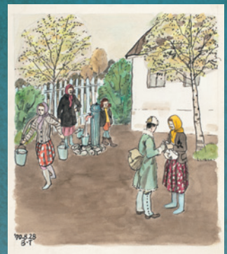
《ヨーグルトをくれる主婦》

昭和19（1944）年、36歳で満州（現・中国東北部）へ召集され、終戦後、シベリアで抑留生活を送り昭和22年に復員しました。昭和48年に亡くなるまで、ライフワークとして、自身の体験に基づいたシベリア抑留の絵を描き続けました。