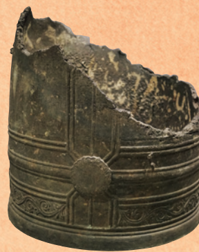
岡山空襲で被災した鐘 （岡山シティミュージアム 所蔵）

岡山市北区駅元町15-1 岡山シティミュージアム5階 TEL 086-253-7070 https://www.city.okayama.jp/okayama-city-museum/0000022330.html