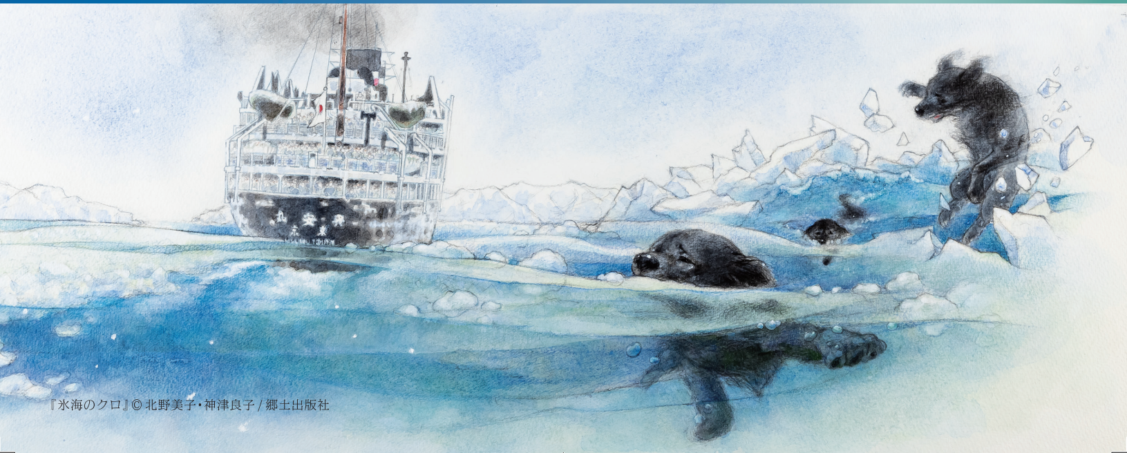
『氷海のクロ』©北野美子・神津良子 / 郷土出版社