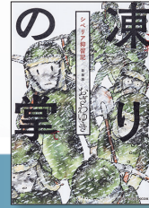
『凍りの掌 シベリア抑留記』

戦後76年が過ぎ、彼らが自身の体験を語ることは難しくなっています。本展では、実父の戦争・抑留体験を描いた漫画『凍りの掌 シベリア抑留記』（作・おざわゆき）と、抑留者の心の支えとなった実在の犬を描いた絵本『氷海のクロ』（文・神津良子 絵・北野美子）の原画を展示します。これらは、戦争の記憶が風化する中、戦争を体験していない世代の作家が、抑留者の体験を後世へ伝えたいという想いから生み出した作品です。本展が、シベリア抑留を知り、戦争のことを考えるきっかけとなれば幸いです。