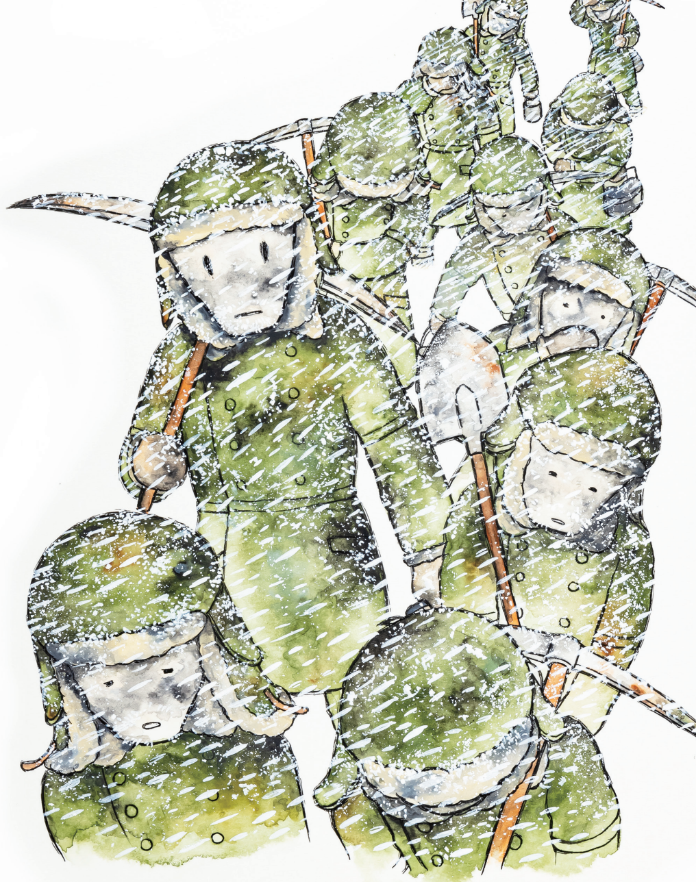
『凍りの掌 シベリア抑留記』©おざわゆき / 講談社