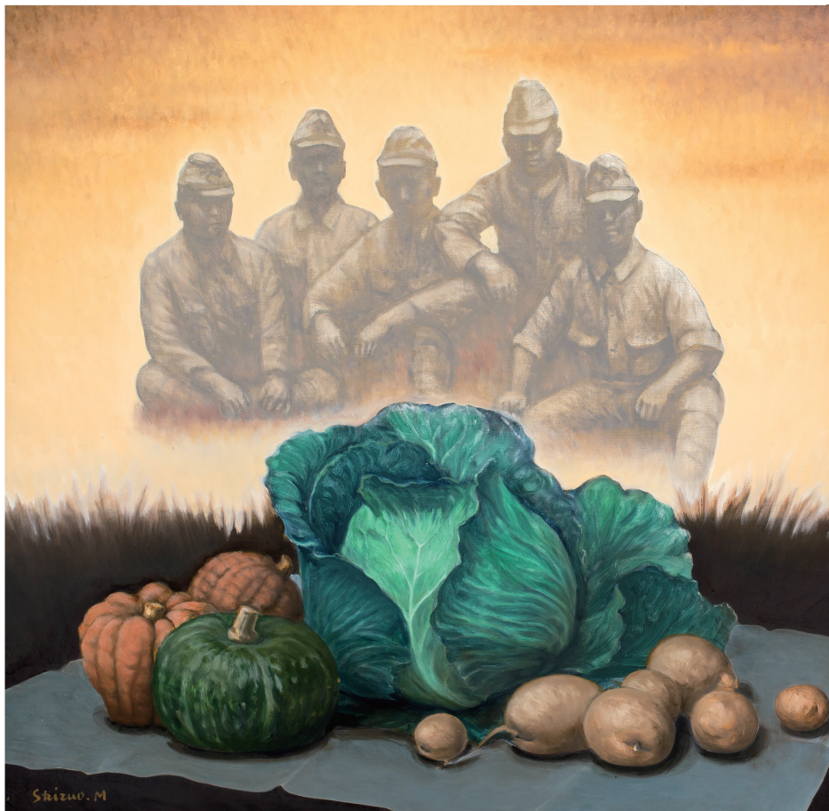
収穫と曠野の幻影(2011年)