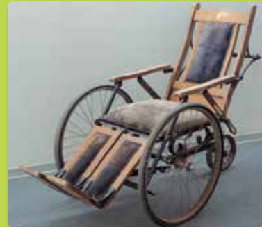
◀県内の戦傷病者の方から 寄贈された箱根式車椅子

戦争で傷つき、あるいは病にたおれた方と そのご家族が戦中・戦後に体験したさまざまな 労苦を紹介します。