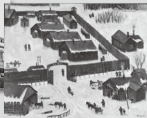
▲ 「収容所の冬景色」佐藤清画