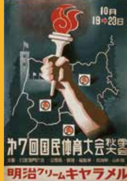
◀ポスター「第7回国民体育大会秋季大会」 昭和26年