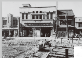
◀ 食べ物の不足をおぎなうために洋品店前につくられた菜園・福島市昭和20年(1945)11月10日

昭和館(東京・九段下)は、戦中・戦後における国民生活上の労苦を後世に伝える博物館です。本展では、福島県にかかわる資料を中心に、厳しい時代を生き抜いた人々が綴った手記や、その姿を記録した写真、当時の実物資料などを通じ、当時を生きた人々の様々な想いや、苦難の多かった暮らしの様子を紹介します。