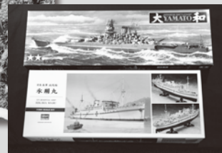
▲ 左手一本で描いた海洋船舶画家上田毅八郎の作品を展示します