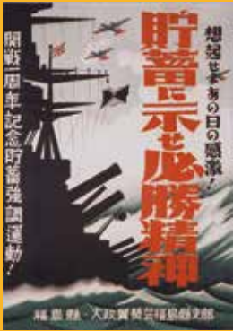
◀ポスター「貯蓄に示せ必勝精神」 昭和17年

戦中・戦後という厳しい時代を生き抜いた人々のくらしや想いを、福島県にかかわる実物資料や写真などから紹介します。