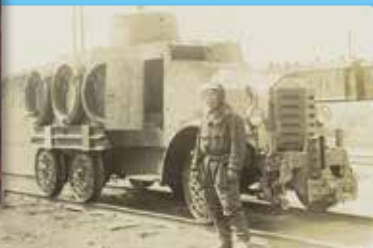
▲ハルビン駅に出勤した鉄道連隊の軌道車