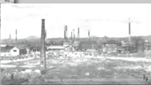
▶ 郡山駅東方にあった軍需工場地帯の焼跡・郡山市昭和21年(1946)