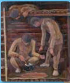
▲「夕食の分配」佐藤清画

鉄道連隊にいた元兵士が持ち帰った満州での 部隊写真や、シベリア抑留者が描いた絵画作品 と関係する実物資料を紹介します。