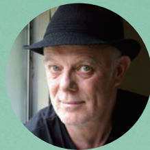
モーガン・フィッシャー

時間：①12:50-13:10 ②14:00-14:20 ③15:10-15:30