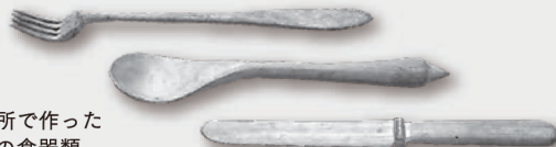
■収容所で作った手製の食器類

戦争が終結したにもかかわらず、シベリアを始めとする旧ソ連やモンゴルの酷寒の地において、乏しい食糧と劣悪な生活環境の中で過酷な強制労働に従事させられた方々に関する資料を紹介します。