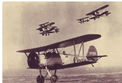
霞空を飛ぶ赤とんぼ(九三式中間練習機)