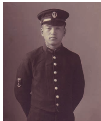
第一種軍装(通称七つボタン)の予科練習生

予科練平和記念館は、予科練の歴史や阿見町(茨城県)の戦史の記録を保存・展示するとともに、次の世代に正確に伝承し、命の尊さや大切さを考えていただくことを目的として、2010(平成22)年に開館し、昨年15周年を迎えました。本交流展では、大空への憧れを胸に予科練生となった少年たちが受けた訓練・教育や日々の生活、戦後の様相を、予科練平和記念館の所蔵する資料を通して紹介します。