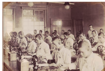
モールス信号の訓練