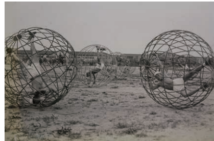
操転器による訓練