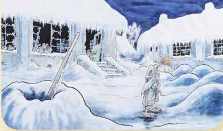
ちばてつや「トモちゃんのおへそ」