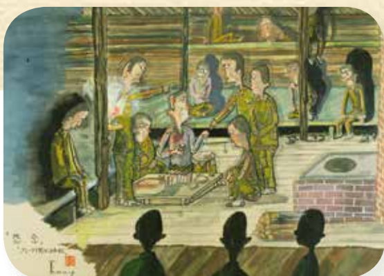
上河辺長「<黒パン>分配」