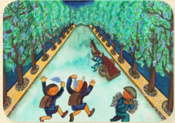
川崎志昭「アカシヤ並木」