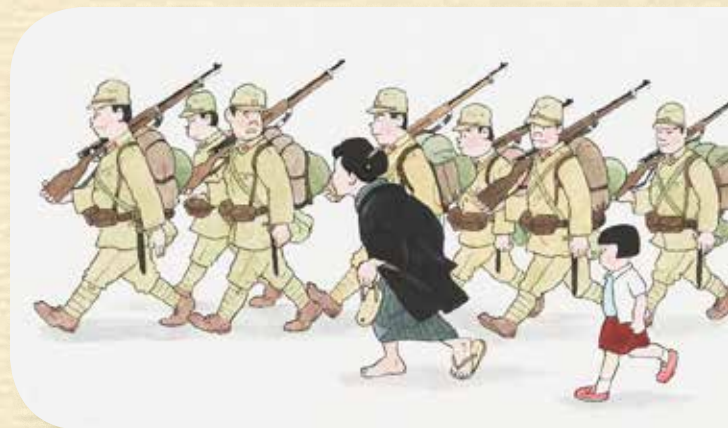
斎藤邦雄「戦地へ立つ日」