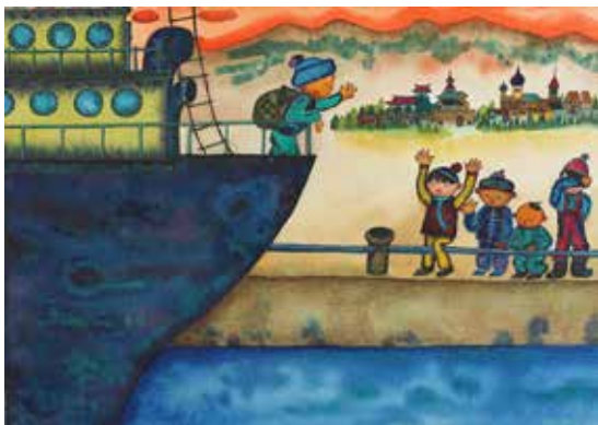
川崎忠昭「さよなら大連」