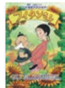
フィチンさん ©上田トシコ/ エクラアニメル