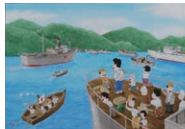
北見けんいち「引揚げ船上から見た 日本は本当に美しかった」